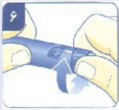
نحوه تزریق انسولین:

سوزن را به طور کامل داخل پوست کنید. برای تزریق، دکمه فشاری را تا انتها فشار دهید تا عدد صفر مقابل نشانگر قرار گیرد. بعد از تزریق تا زمان خارج کردن سوزن از پوست دکمه فشاری را کامل فشرده نگه دارید. سوزن باید حداقل ۶ ثانیه زیر پوست بماند تا اطمینان حاصل شود که دوز کامل وارد بدن شده است.